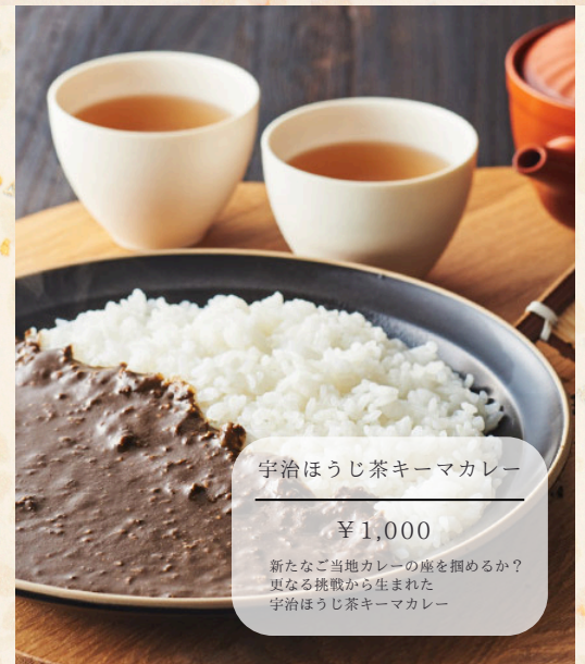
宇治ほうじ茶キーマカレー